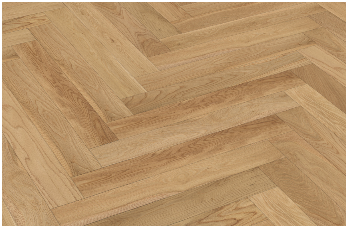
Photo non contractuelle, le bois, matériau vivant présente des variations naturelles de teintes et veinage, des singularités telles que le brossage, densité, taille des nœuds, gerces, mastigages... Chaque lame est originale et différente, c'est ce qui confère toute la richesse et la noblesse au bois. Il est essentiel de rappeler qu'une exposition aux UV génère une variation durable de la teinte du bois. Le Client est invité à se référer à la fiche technique du produit afin de connaître ses caractéristiques