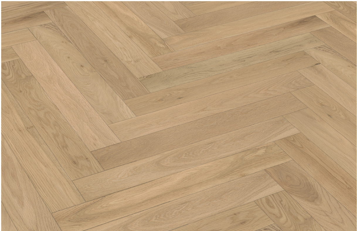
Photo non contractuelle, le bois, matériau vivant présente des variations naturelles de teintes et veinage, des singularités telles que le brossage, densité, taille des nœuds, gerces, masticages... Chaque lame est originale et différente, c'est ce qui confère toute la richesse et la noblesse au bois. Il est essentiel de rappeler qu'une exposition aux UV génère une variation durable de la teinte du bois. Le Client est invité à se référer à la fiche technique du produit afin de connaître ses caractéristiques