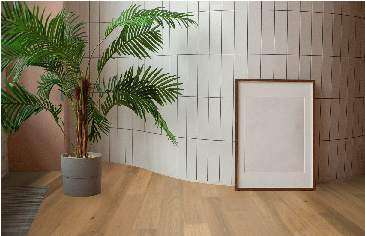
Photo non contractuelle, le bois, matériau vivant présente des variations naturelles de teintes et veinage, des singularités telles que le brossage, densité, taille des nœuds, gerces, masticages... Chaque lame est originale et différente, c'est ce qui confère toute la richesse et la noblesse au bois. Il est essentiel de rappeler qu'une exposition aux UV génère une variation durable de la teinte du bois. Le Client est invité à se référer à la fiche technique du produit afin de connaître ses caractéristiques